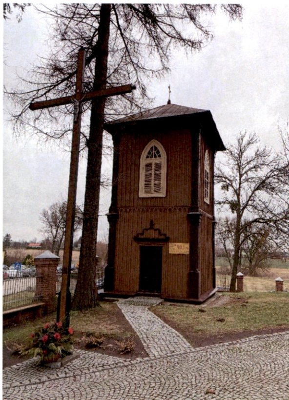
ERysunek 9 – Dzwonnica od strony południowej