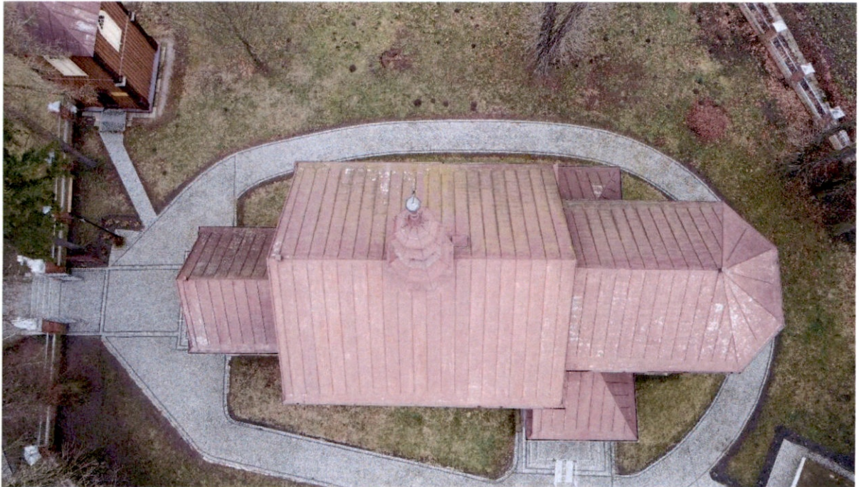
Rysunek 6 – Widok z góry