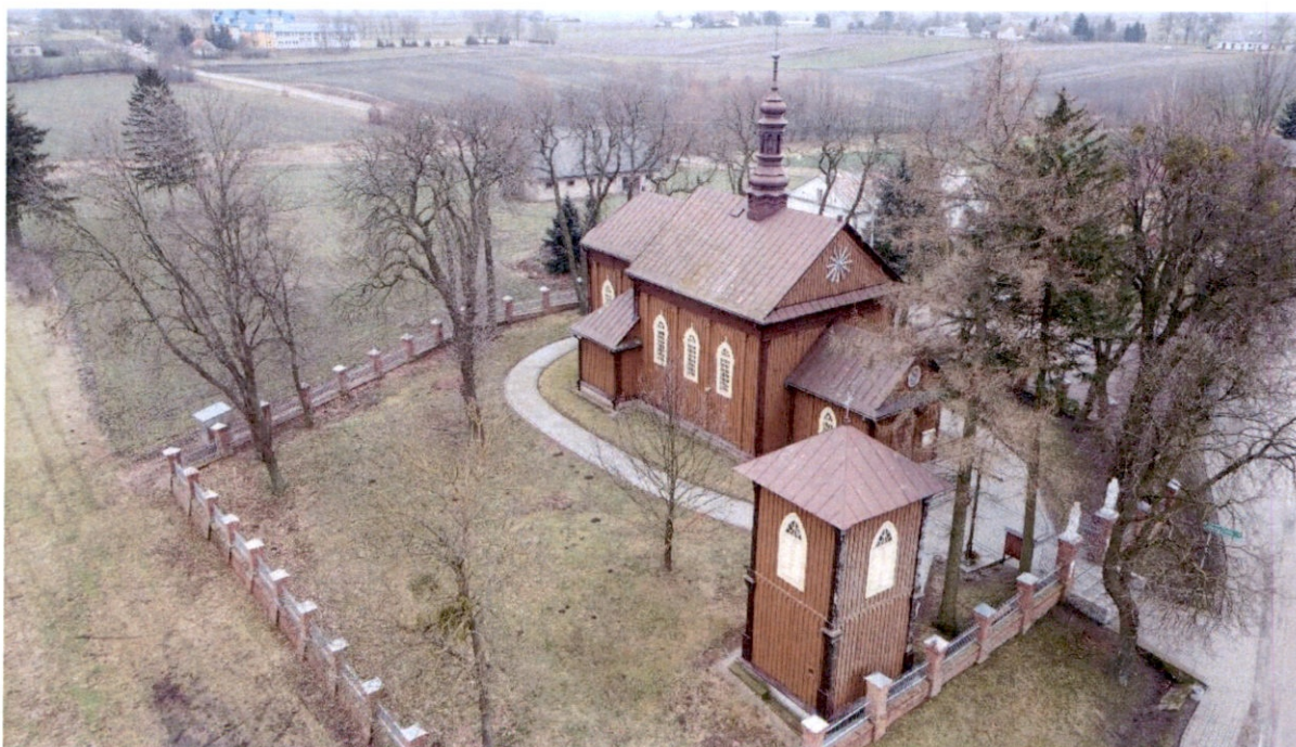
Rysunek 8 – Widok z góry na dzwonnice oraz kościół – północny-zachód