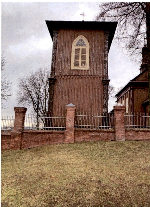
Rysunek 11 – Dzwonnica od strony zachodniej