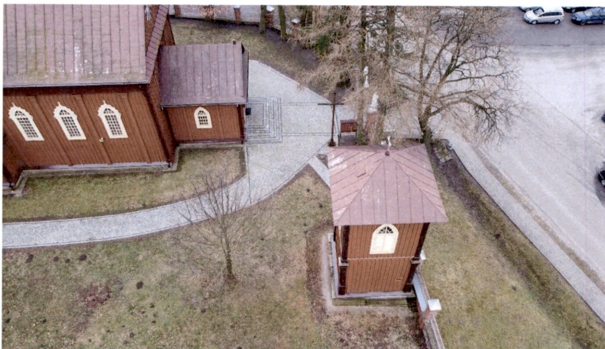
Rysunek 7 – Widok z góry na dzwonnice od strony północnej