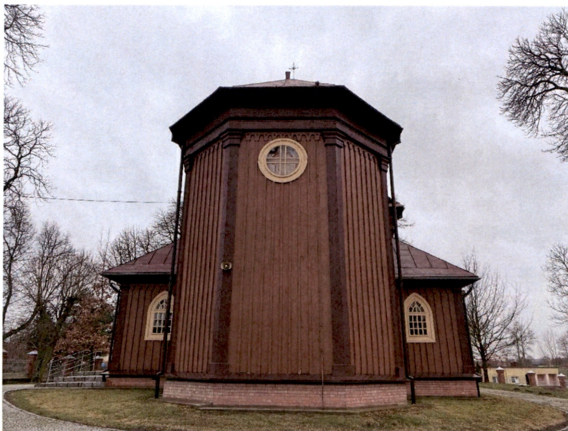
Rysunek 14 – Kościół od strony wschodniej