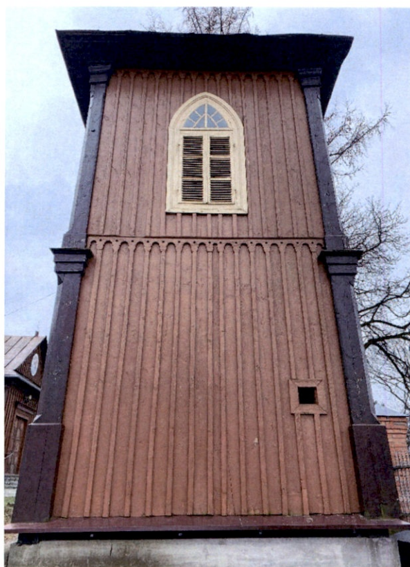
Rysunek 10 – Dzwonnica od strony północnej