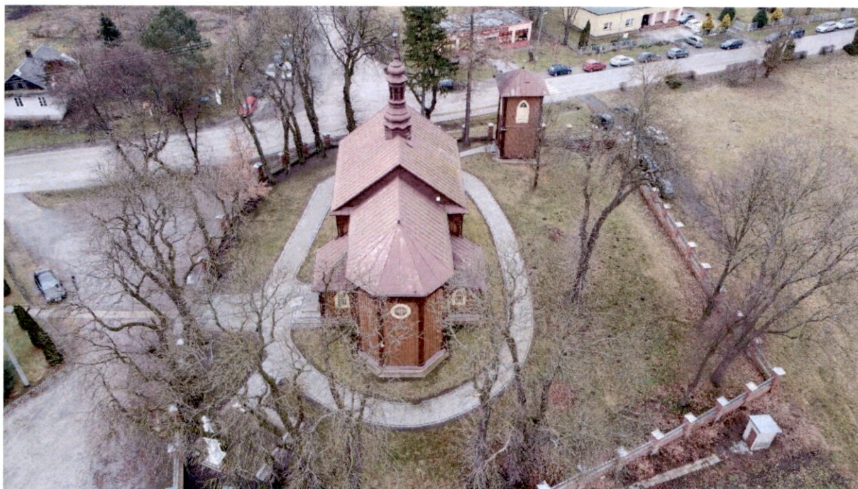
Rysunek 3 – Widok z góry na elewację wschodnią