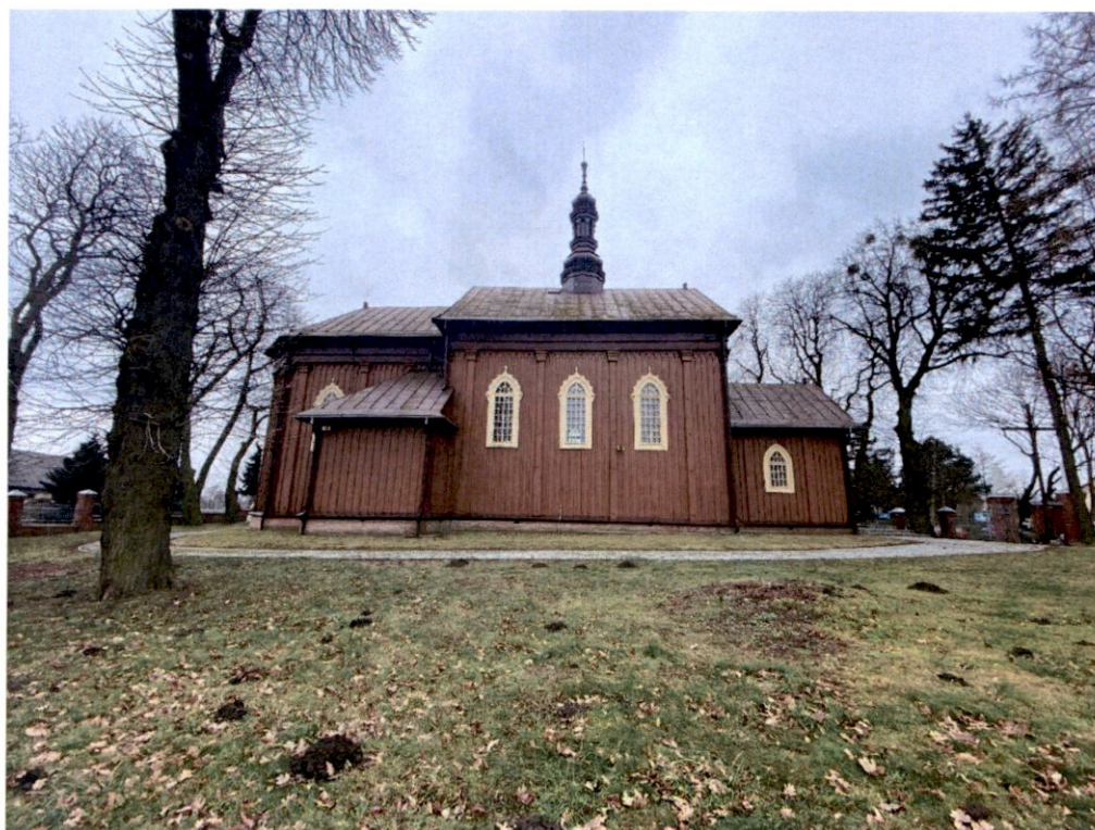
Rysunek 16 – Kościół od strony północnej