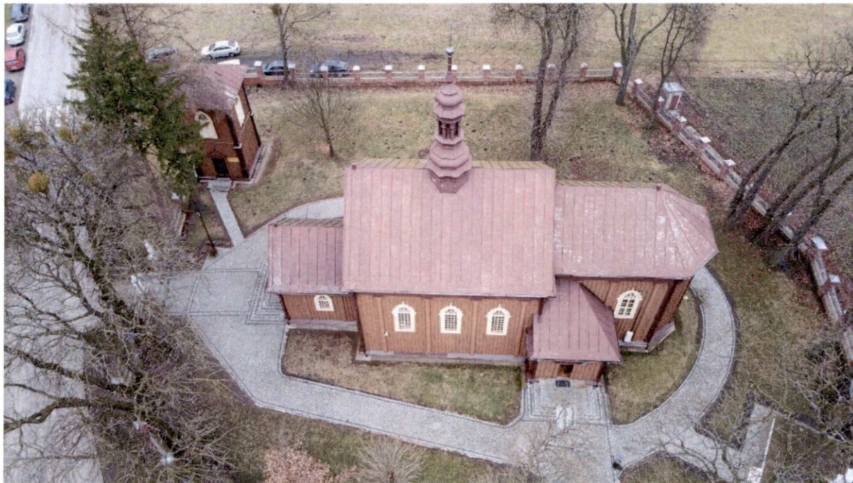
Rysunek 2 – Widok z góry na elewację południową