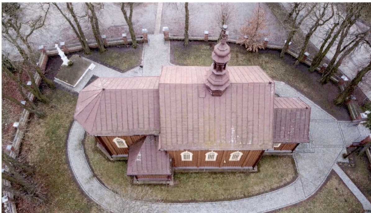
Rysunek 1 – Widok z góry na elewację północną