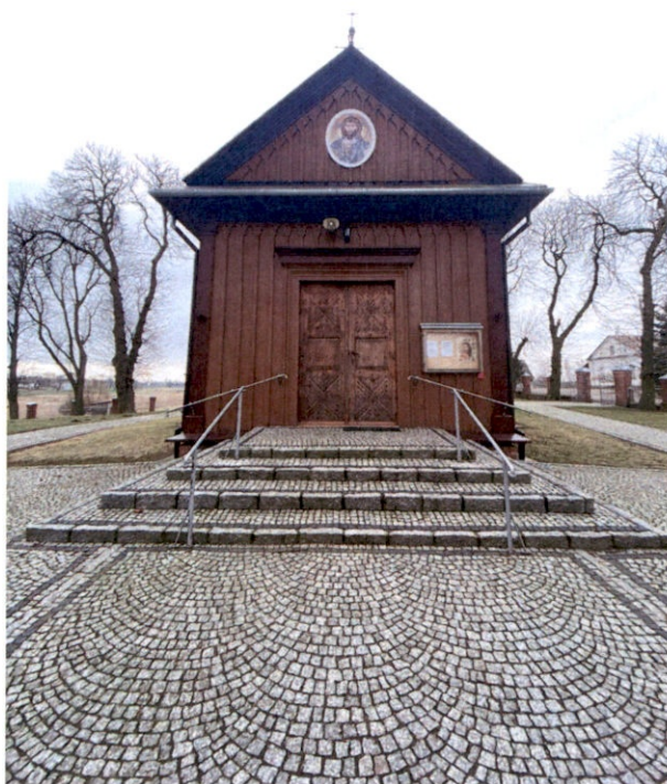
Rysunek 13 – Kościół od strony zachodniej