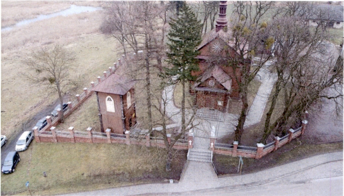
Rysunek 5 – Widok z góry na elewację zachodnią