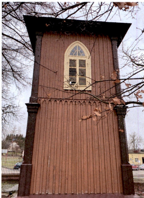
Rysunek 12 – Dzwonnica od strony wschodniej