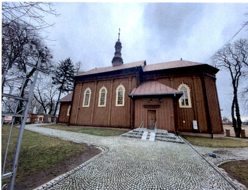
Rysunek 15 – Kościół od strony południowej