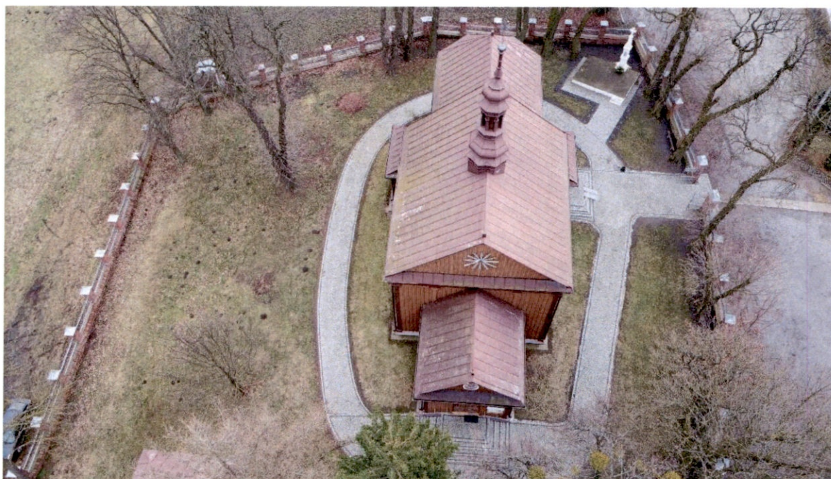
Rysunek 4 – Widok z góry na elewację zachodnią